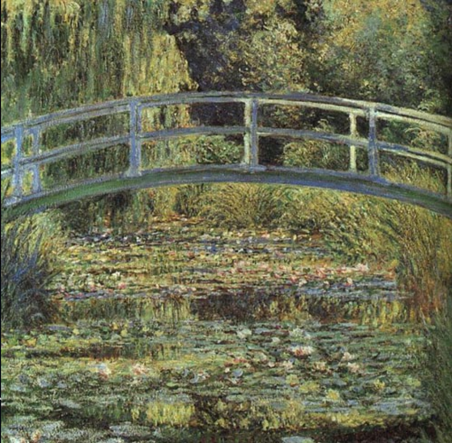
Claude Monet (1840-1926), Le jardin des Nymphéas, harmonie verte , 1899, huile sur toile, 89,5 x 92,5 cm, Musée d'Orsay, Paris