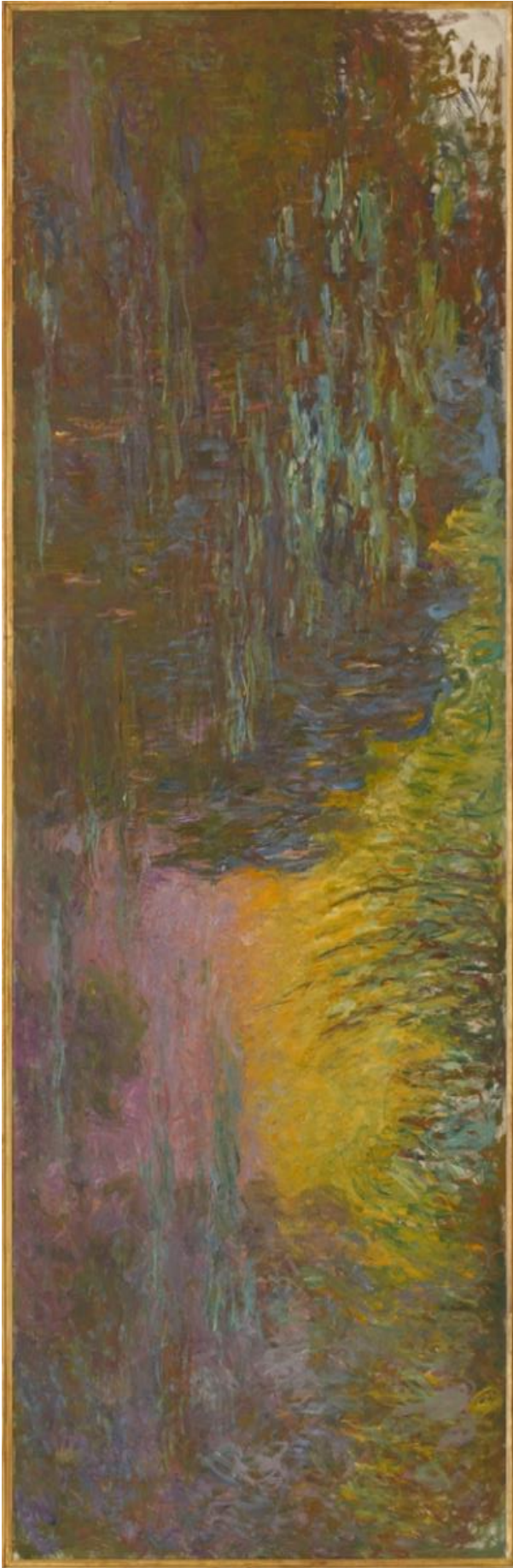
Claude Monet (1840- 1926), Les Nymphéas : Soleil couchant, Vers 1915- 1926, Huile sur toile, 200 x 600 cm, Musée de l'Orange- rie, Paris