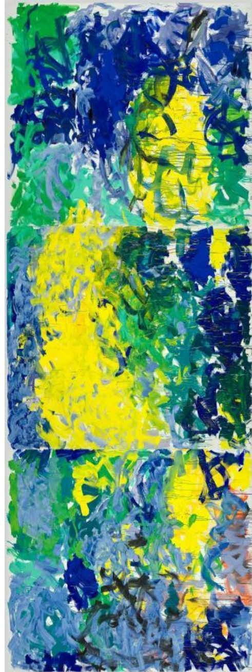
Joan Mitchell (1925- 1992), La Grande Vallée XIV , 1983. huile sur toile, 280 x 600 cm, Centre Pompidou, Paris