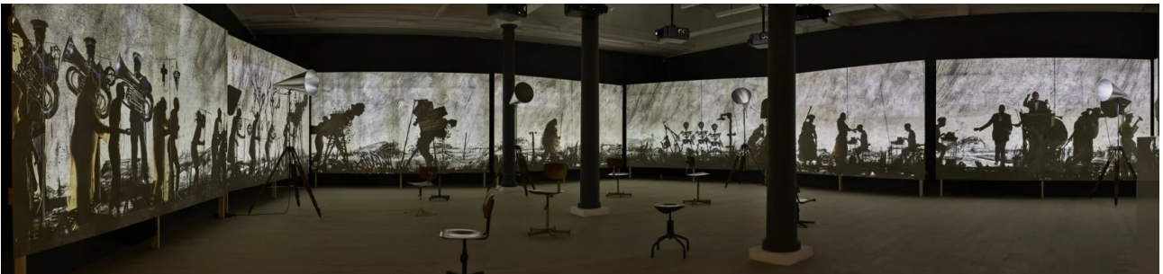
William Kentridge (1955-), More Sweetly Play the Dance (Jouer la danse plus doucement) , 2015, dimensions variables, installation vidéo 8 canaux haute définition, 15 min, avec 4 porte-voix. Ottawa, musée des beaux-arts du Canada. (Vue de l'ensemble et détail).