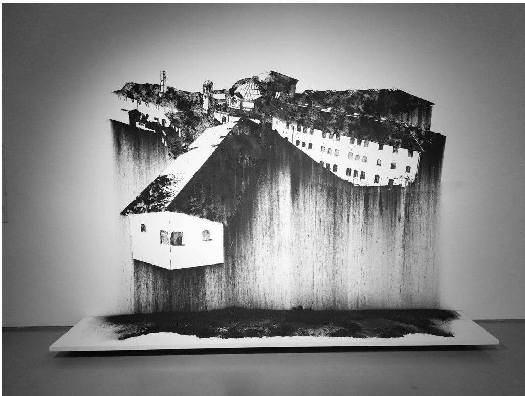
Nicolas Daubanes (1983- ), Prison Saint-Michel , Toulouse, 2019. Dessin mural à la poudre d'acier aimantée, 200 x 280 cm. Vue de l'exposition Confinement- Politics of Space and Bodies, CAC Cincinnati