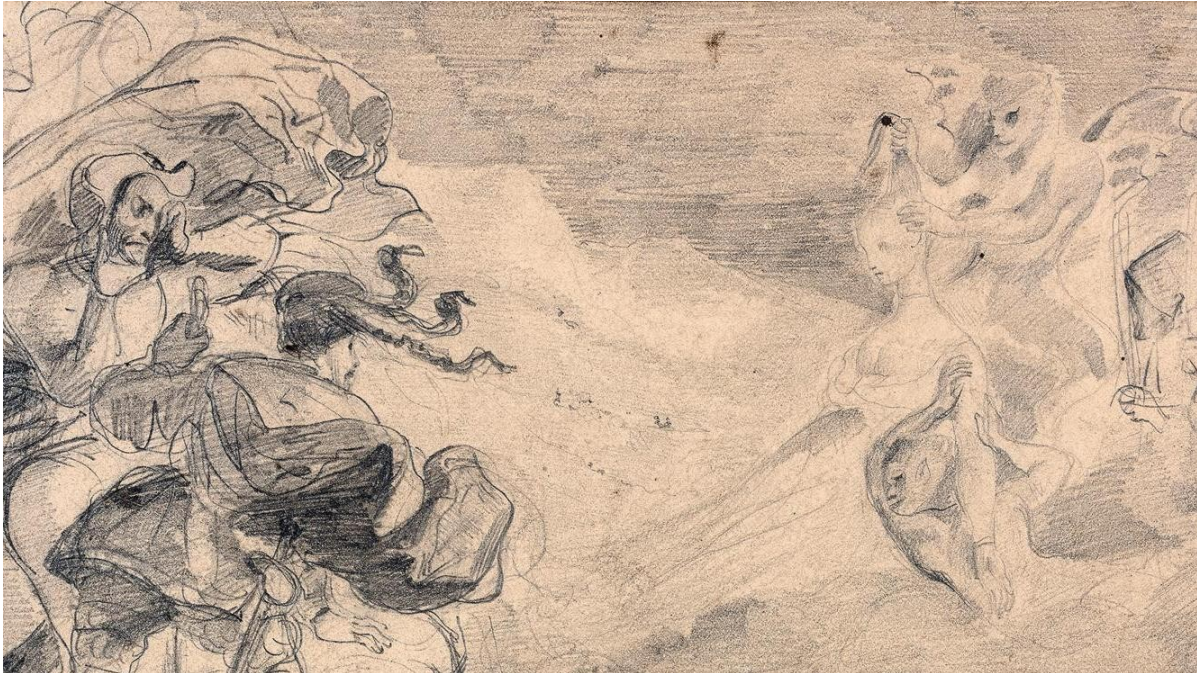
Eugène Delacroix (1798-1863), L'Ombre de Marguerite apparaissant à Faust , crayon noir, 24,2 x 32,2 cm. Collection particulière.