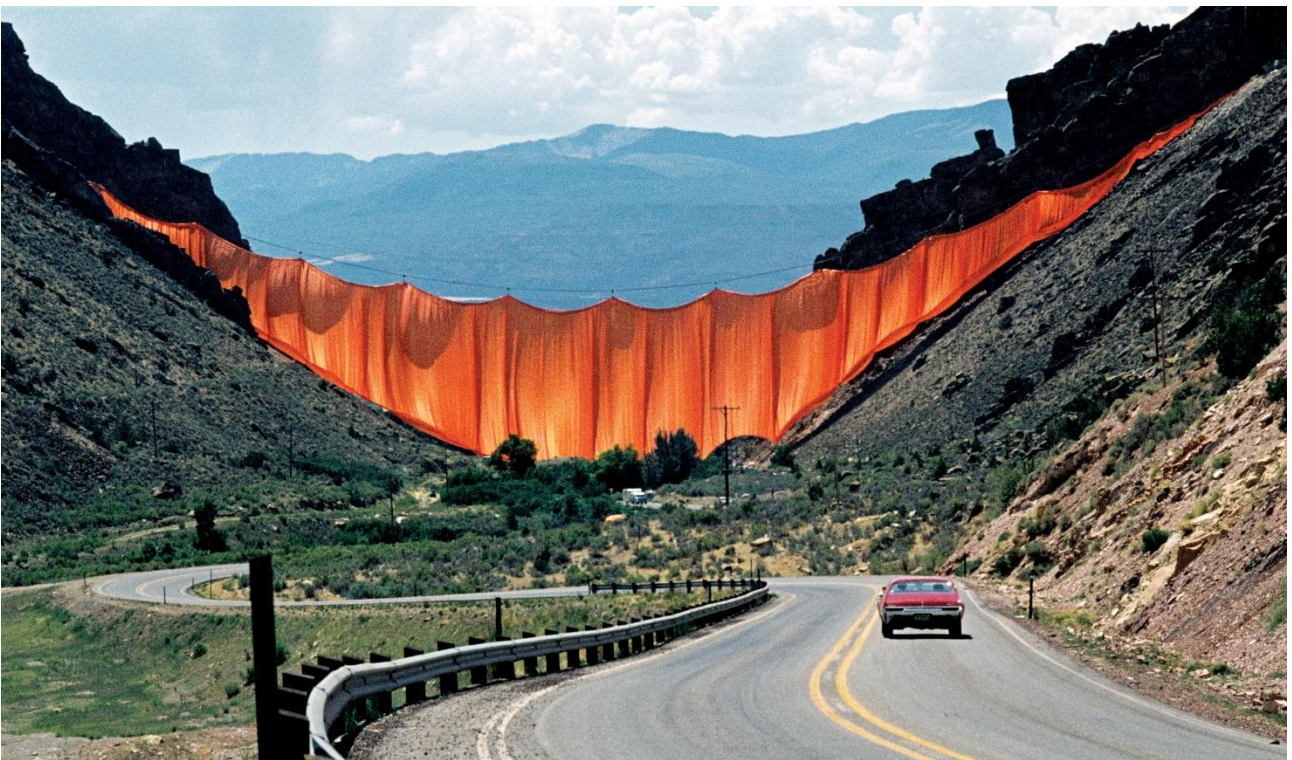
Christo and Jeanne-Claude, Valley Curtain, Rifle, Colorado , 1970-72, rideau de nylon orange de 12780 m 2 , câbles, fondations en béton, 381 x 111 m, installée le 10 août 1972.