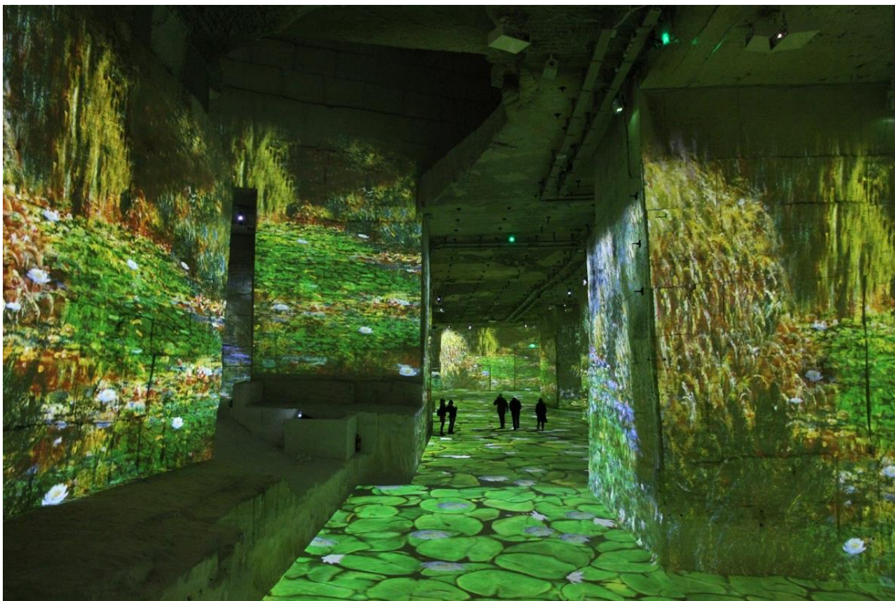
Vue de l'exposition « Monet, Renoir... Chagall. Voyages en Méditerranée » à L'Atelier des lumières à Paris du 28 février au 31 décembre 2020.

« Il est du principe de l'œuvre d'art d'avoir toujours été reproductible. Ce que des hommes avaient fait, d'autres pouvaient toujours le refaire. Ainsi, la réplique fut pratiquée par les maîtres pour la diffusion de leurs œuvres, la copie par les élèves dans l'exercice du métier, enfin le faux par des tiers avides de gain. Par rapport à ces procédés, la reproduction mécanisée de l'œuvre d'art représente quelque chose de nouveau (...).