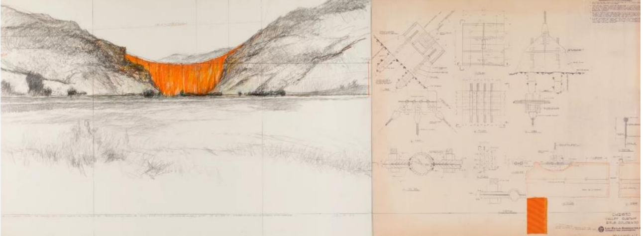
Christo (1935-2019), Valley Curtain (Project for Colorado) , Collage 1971, Crayon, fusain, crayon de cire, dessin technique, ruban adhésif et échantillon de tissu, 91 x 244 cm, Collection Lambert, Avignon