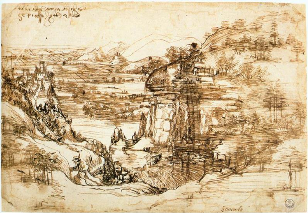
Léonard de Vinci (1452-1519), Paysage de la vallée de l'Arno *, 05 août 1473, encre sur papier, 19 x 28,5 cm, Galerie des Offices, Florence

*L'Arno est un fleuve qui traverse la vallée du Po en Italie et notamment la ville de Florence dans laquelle Léonard de Vinci a vécu.